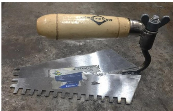
Figura II – Colher de pedreiro com parafuso sextavado com rosca borboleta