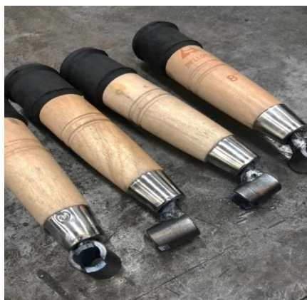
Figura III – Borracha adicionada ao cabo da colher

Por último, ainda foi necessário solucionar a questão referente ao martelo de borracha, que também deveria ser incorporado à ferramenta. Como solução, foi adicionado ao cabo da colher uma borracha de 3 cm de diâmetro retirada de um tarugo (Figura III).