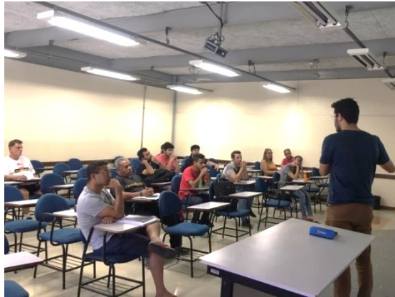
Figura IV – Aula expositiva na PUC Minas unidade São Gabriel