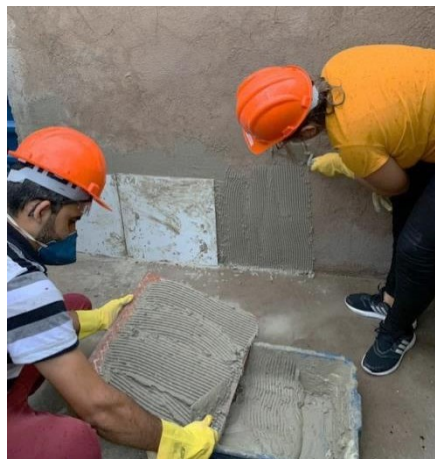
Figura V – Curso prático na PUC Minas unidade São Gabriel

A segunda tarefa foi a aplicação prática com utilização da ferramenta. Orientados pelos professores dos dois projetos, alunos e aprendizes de técnicas de construção realizaram a instalação de placas de revestimento cerâmico em alvenaria já devidamente elevada. A colher multifuncional foi utilizada para o preparo e aplicação da argamassa, bem como o assentamento das peças cerâmicas (Figura V). Na medida em que a instalação era realizada, os alunos anotavam as observações apresentadas pelos executores.