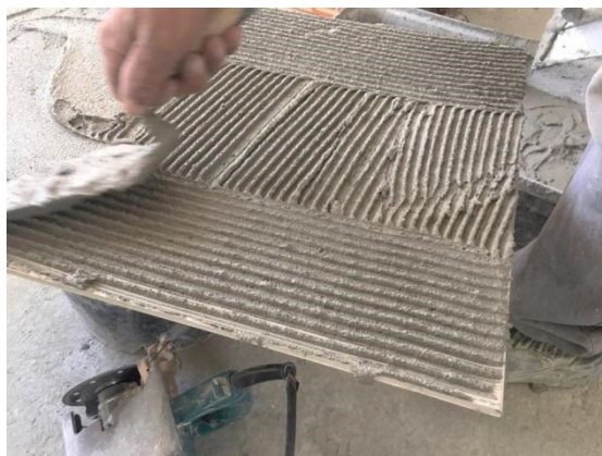
Figura VI – Aplicação da ferramenta na obra