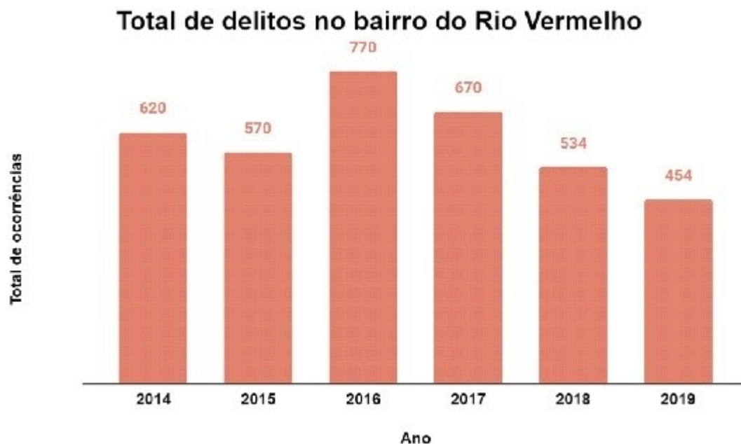
Figura 3 – Total de delitos no bairro do Rio Vermelho.