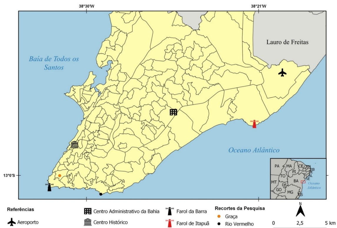
Figura 1 - Localização dos recortes da pesquisa

Esses empreendedores, em geral localizados no entorno de estações de transbordo, shoppings e grandes lojas, expressam na paisagem a indissociabilidade dos dois circuitos da economia, a centralidade sendo criada a partir da atração exercida pelo circuito superior. Essa indissociabilidade também pode ser observada entre os “barraqueiros” 2 da praia de Piatã e os depósitos e distribuidores de bebidas, demonstrando a grande dependência entre o comércio e os serviços de rua e o comércio atacadista/as empresas distribuidoras do circuito superior (SERPA; LEITE; MACHADO, 2019). Ainda que, no caso de algumas dessas empresas, possa-se pensar em um circuito superior “marginal”, devido aos níveis de técnica e capital envolvidos, assim como ao porte dos estabelecimentos e à mão de obra pouco especializada 3 (SANTOS, 2004).