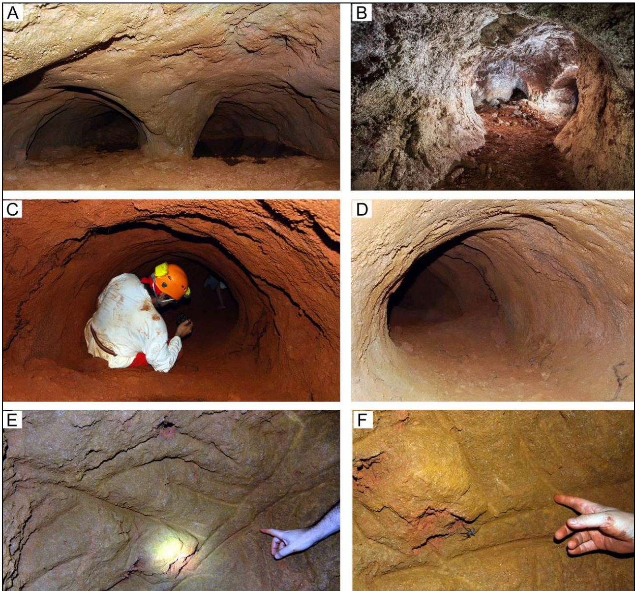
Figura 3 - Aspectos da paleotoca. A - Galeria com coluna de sustentação. B-D - Galerias escavadas com feições arredondadas, incluindo superfícies de polimento em D (diâmetros c. 150 cm). E-F - sulcos (marcas de garras) na parede indicando atividade de animal cavador.

Considerando os critérios e parâmetros elencados por Cachão et al. (1998), do ponto de vista científico a paleotoca da Serra do Gandarela pode ser enquadrada nos parâmetros paleoecológico, estratigráfico e geológico. O QF está entre as regiões geológicas mais estudadas e conhecidas do Estado de Minas Gerais, tendo seu valor científico reconhecido em todo o mundo. Especificamente sobre sítios paleontológicos a ocorrência desse registro é rara sendo a única conhecida em Minas Gerais até o momento o que remete à necessidade de conservação. Propostas semelhantes estão em andamento nas paleotocas do município de Cristal no Rio Grande do Sul, reconhecida como importante sítio geológico e paleontológico brasileiro pela Comissão Brasileira de Sítios Geológicos e Paleontológicos – SIGEP (BUCHMANN et al., 2010), e nas paleotocas do município de São Joaquim, em Santa Catarina.