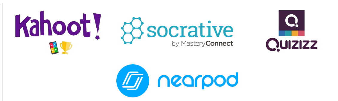
Figura 4 – Plataformas de aprendizagem baseadas em jogos