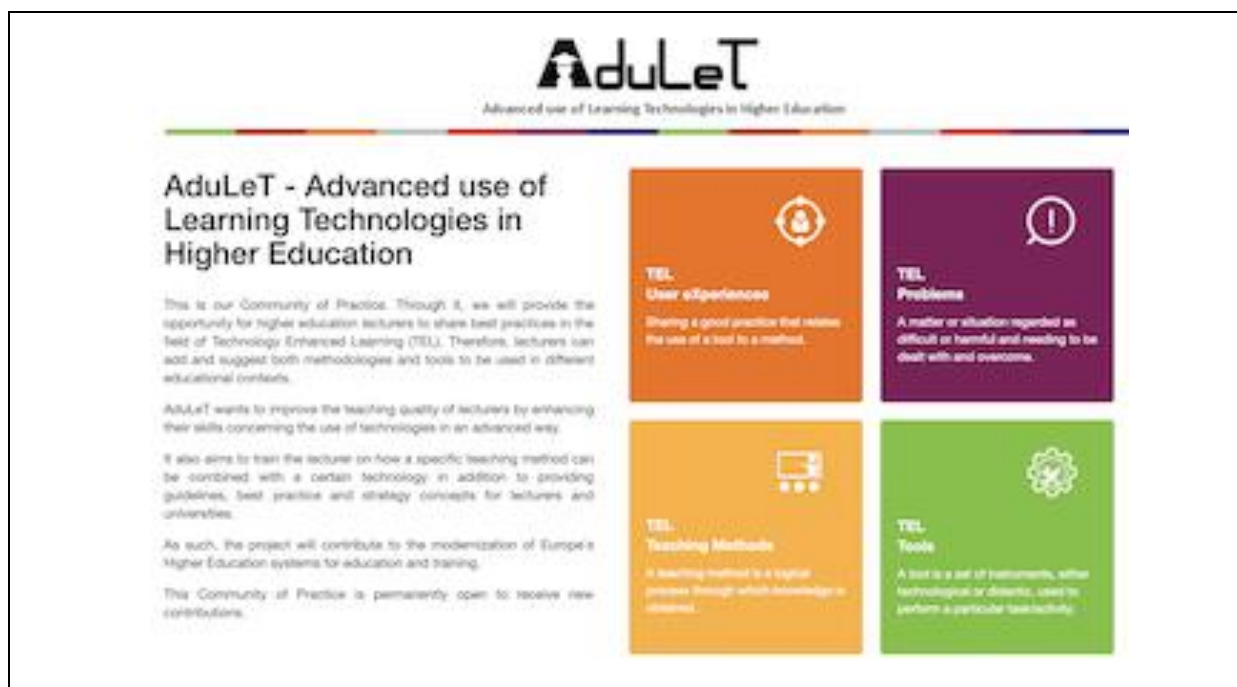
Figura 5 – Plataforma AduLeT