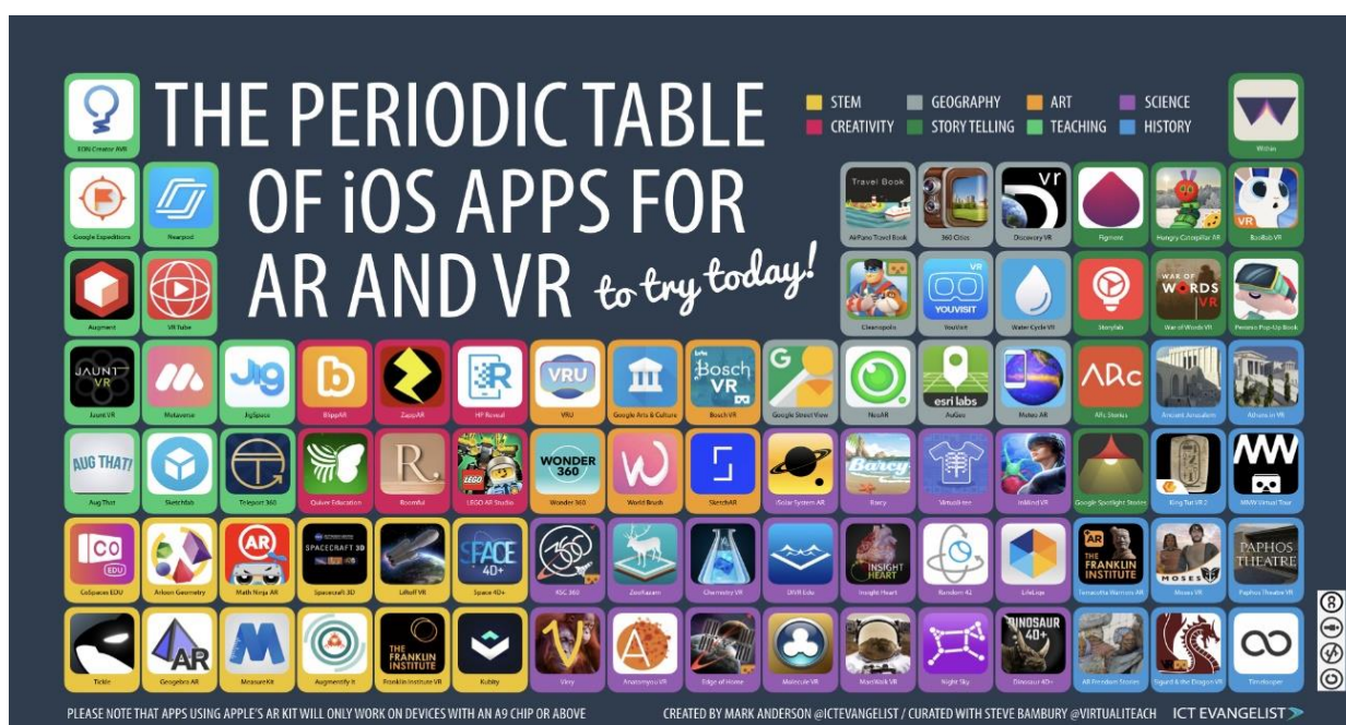
Figura 3 – Tabela periódica de apps IOS para realidade virtual e realidade aumentada