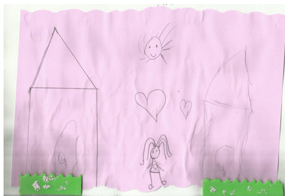
Figura 1 - Representação da família

Fonte: desenho elaborado pela criança participante.