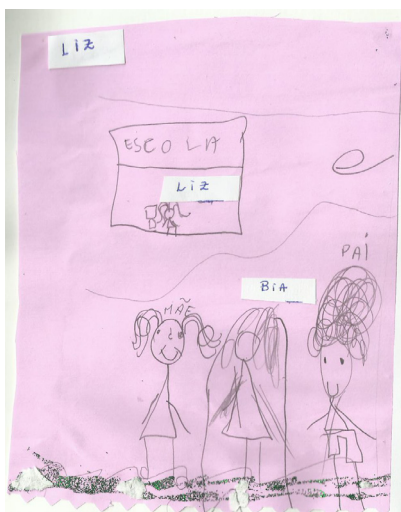
Figura 2 - Segunda representação de família

Fonte: desenho elaborado pela criança participante.