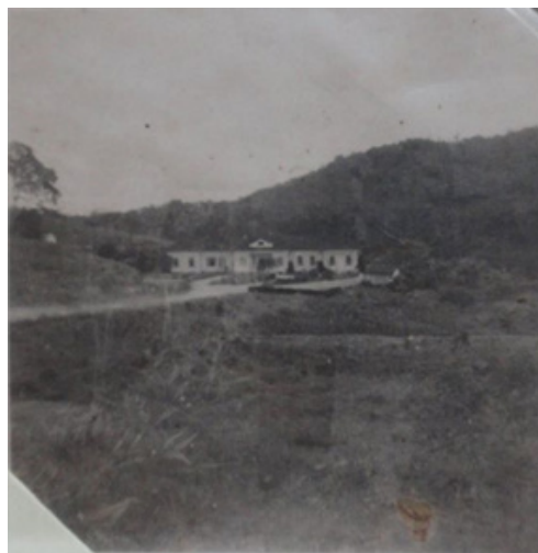
Figura 1 - Registro fotográfico do Abrigo de Alienados