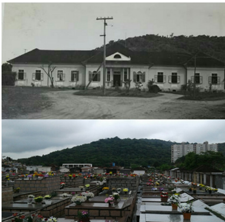
Figura 2 - Paisagem pretérita e atual do terreno do cemitério