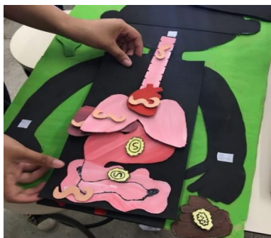
Figura 1: Modelo explicativo em velcro.