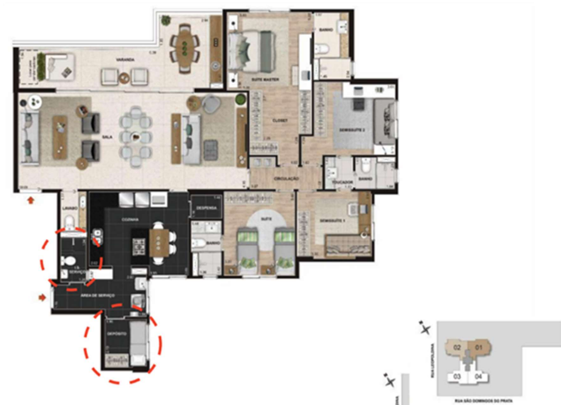
Figura 4: Plantas Humanizadas Fonte: Caparaó, 2022 e Canopus, 2018 - alterado pelo autor