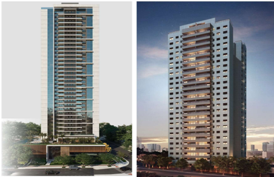
Figura 1: Escala Urbana

A cena inicia-se com Figura 1, que apresenta a Escala Urbana: momento mais ampliado da contemplação pelas montagens. Composta por perspectivas externas das fachadas retiradas dos sites publicitários, sua visualização permite explorar as intenções, possibilidades e conexões da edificação com o seu contexto urbano.