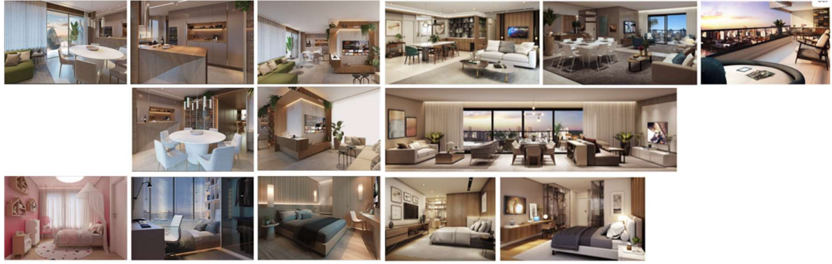
Figura 3: Escala Individual