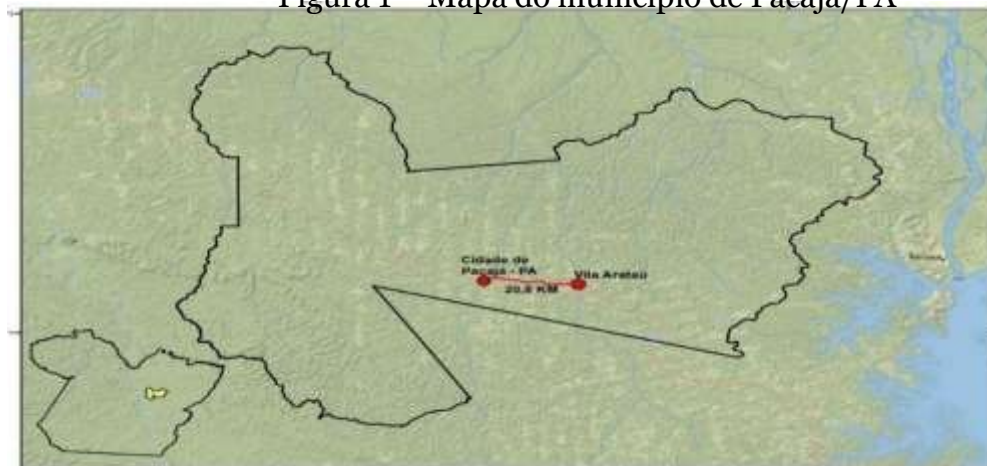
Figura 1 – Mapa do município de Pacajá/PA