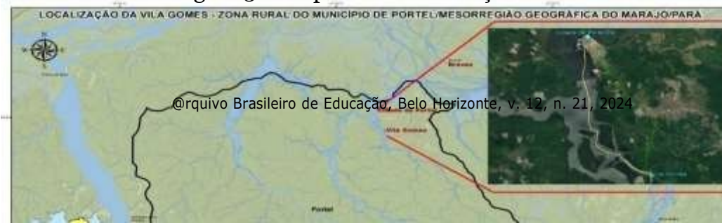
Figura 3 – Mapa com a localização da Vila Gomes

A Figura 2 mostra que a MGM vem se tornando a região, onde a implantação/expansão do SEI tem ocorrido de forma mais acentuada. O quantitativo de localidades, onde o projeto já havia sido implantado nessa região até o ano de 2021, representava 40% do total de localidades. A comunidade ribeirinha denominada Vila Gomes, que está localizada na zona rural do município de Portel-PA, à margem esquerda do rio Banã, afluente do rio Camarapi, fica situada relativamente próxima da cidade de Portel, cerca de 19 km de distância. Com acesso de barco pelo rio Camarapi, a viagem tem a duração de 1 hora. Por estrada de terra, a viagem tem duração de 20 a 30 minutos, e o acesso pode ser feito tanto de carro quanto de motocicleta até um porto próximo à vila e, de lá, é preciso fazer uma travessia de barco que dura em torno de 5 a 10 minutos. A localização e o acesso até a Vila Gomes estão representados abaixo na figura 3.