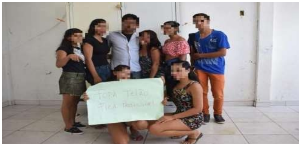
Figura 4 – Manifestação de alunos contrários à implantação do Projeto SEI na Vila Gomes

Ocorre, no entanto que, conforme informações coletadas in loco e analisadas nesta produção, não houve diálogo entre os representantes da SEDUC/PA e os moradores da Vila Gomes, antes da implantação do Projeto SEI na EMEIF Adelson Azevedo, mas apenas na ocasião da inauguração da sala. Embora algumas limitações do SOME, evidenciadas ao longo de seus 10 anos de funcionamento na Vila Gomes, tenham servido para convencer os moradores da vila, de que sua substituição pelo Projeto SEI seria mais viável do que a solução para essas limitações, houve resistência também por parte de alguns alunos do Ensino Médio, oriundos do SOME, conforme podemos observar na Figura 4.