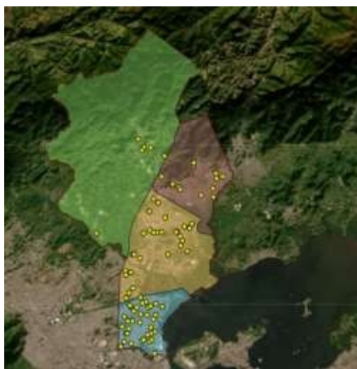
Figura 2: Mapa da cidade de Duque de Caxias contendo as escolas estaduais do território.