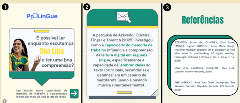
Ilustração 1 10 – Postagem de DC no perfil @prolinguegp