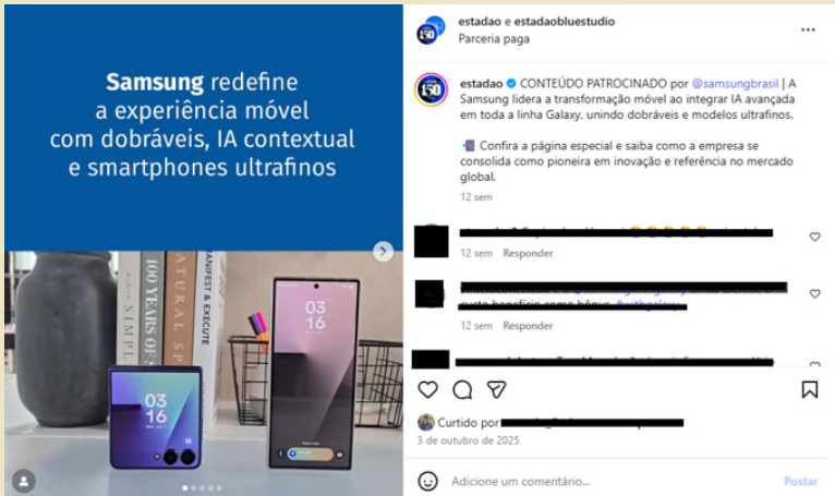
Figura 5 – Publipost feito no perfil do jornal Estadão