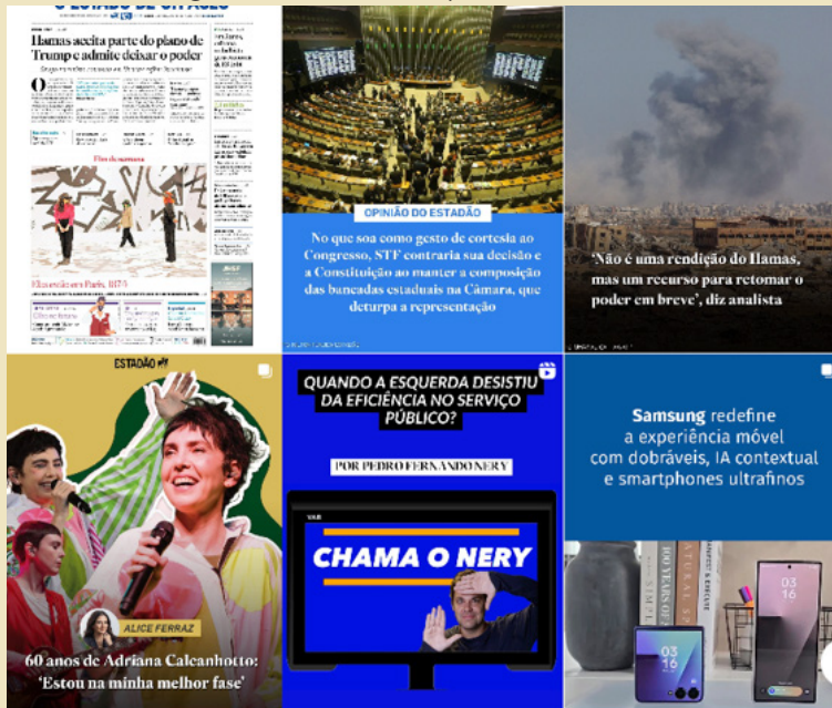
Figura 6 – Perfil do jornal Estadão