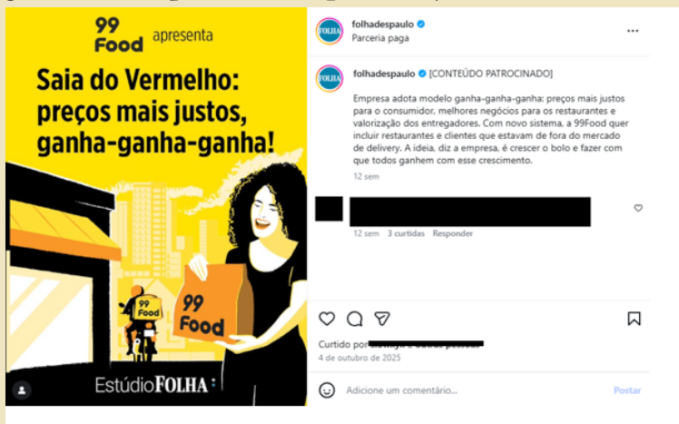
Figura 1 – Publipost feito no perfil do jornal Folha de S.Paulo

Analisaremos, a seguir, três publiposts , com o objetivo de apontar como os jornais organizam sua enunciação e a cenografia para demonstrar que o enunciado se trata de um post do tipo discursivo publicitário. Começaremos apresentando o publipost da Folha de S.Paulo .