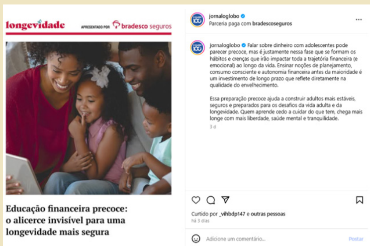
Figura 3 – Publipost feito no perfil do jornal O Globo

O segundo exemplo, retirado do perfil do jornal O Globo (Figura 3), também usa das dimensões procedimental, indicando que o post é uma parceria paga (inclusive marcando o anunciante, algo que a Folha de S.Paulo não faz), e iconotextual para inflar a cenografia de um anúncio publicitário e, dessa forma, tentar evitar que o post seja confundido com seus enunciados jornalísticos.