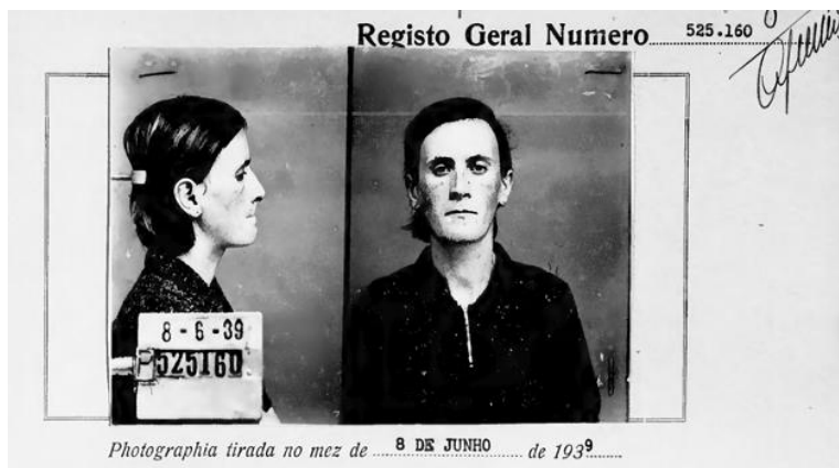
Figura 5- Fotografia de identificação judiciária