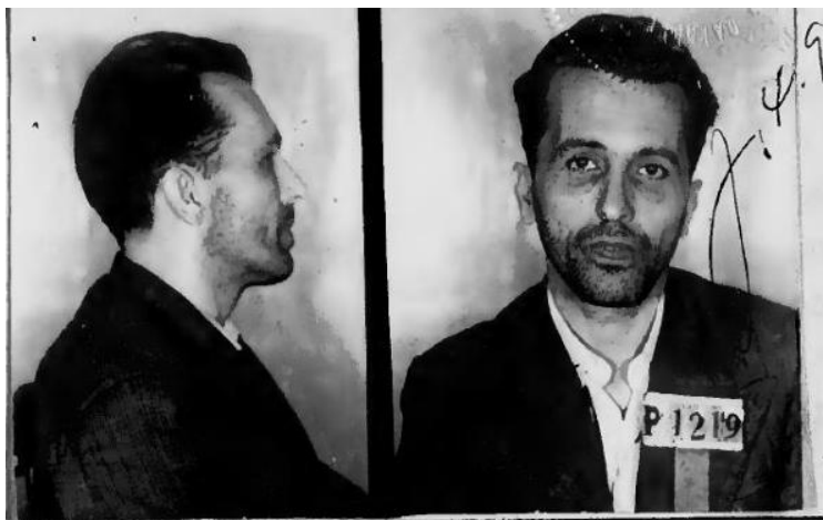
Figura 3 - Fotografia de identificação judiciária