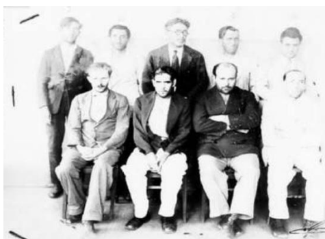
Figura 7- Membros da célula comunista da cidade de Presidente Alves em São Paulo