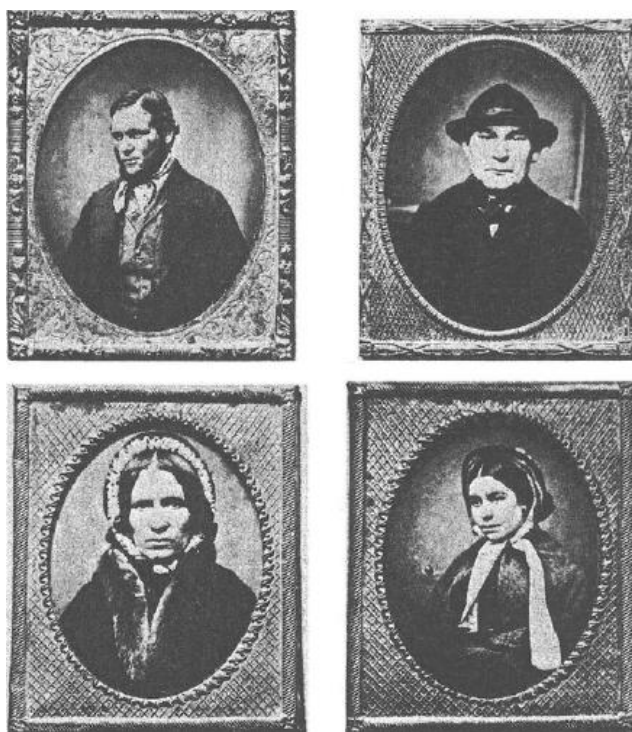
Figura 1- Fotografia de prisioneiros realizada pela polícia de Birminham na Inglaterra

Conforme podemos perceber na imagem abaixo, as fotografias de identificação criminal iniciais possuíam esteticamente uma semelhança visual com os retratos realizados em ateliers de fotógrafos que atendiam as camadas médias urbanas e a elite europeia no século XIX.