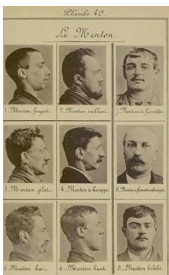
Figura 2- Pranchas de identificação fotográfica

As fotos de retratos de frente e de perfil de um criminoso eram consideradas visivelmente agressivas (SONTAG, 2004, p. 10), a escolha da pose do detento era forjada através de uma imagem ideal que se queria transmitir. Dentro desta prática de identificação, os criminosos eram considerados como elementos passivos ao processo regulatório (TAGG, 1988, p. 11), a sua individualidade seria cerceada por um método de registro que se converteria numa forma de dominação. O uso da fotografia pela polícia acabaria desta forma, por reforçar a construção de um mundo de exclusão, expondo diferenças sociais (PESAVENTO, 2009, p. 16).