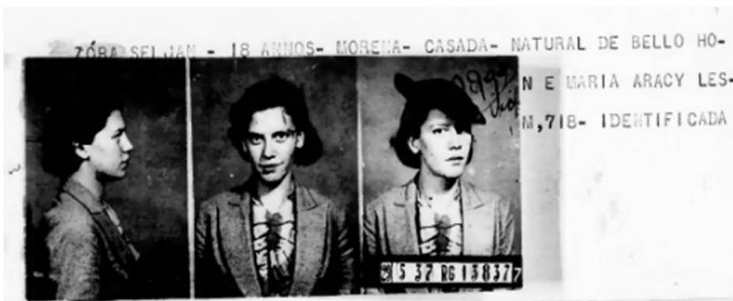
Figura 4 - Fotografia de identificação judiciária