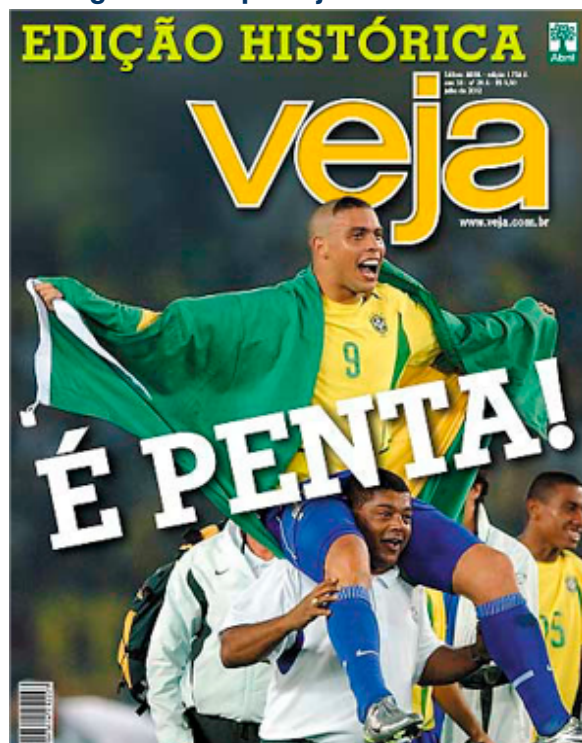
Figura 4 - Capa Veja 30/06/2002

Só em 30/06/2002, três anos depois de ter sido “vitimizado”, Ronaldo voltará à quarta capa da série de Veja (imagem 4). O herói decaído ressurgiu reerguido acima dos mortais. Volta a representar o maior triunfo do futebol brasileiro: a conquista do pentacampeonato mundial de futebol na Copa de 2002.