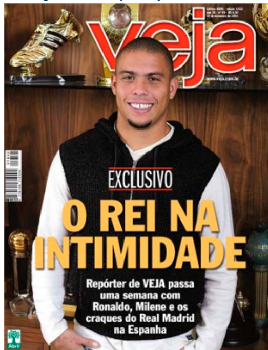
Figura 5 - Capa Veja 10/12/2003