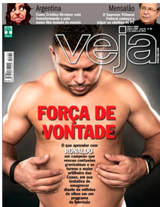
Figura 7 – Capa Veja 03/10/2012