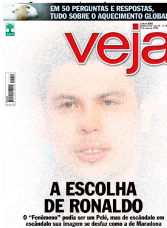
Figura 6 - Capa Veja 07/05/2008