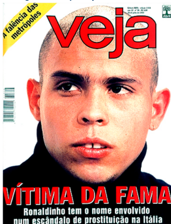
Figura 3 - Capa Veja 28/07/1999

Um ano depois, em 28/07/1999, Veja lança a terceira capa da série em que Ronaldo é mostrado não como o jogador, mas como homem comum envolvido em um escândalo de prostituição (imagem 3). Entretanto, o herói vai aparecer como vítima, não como vilão.