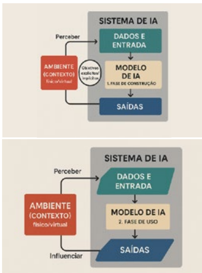
Figura 1. Visão Geral de um Sistema de IA – Fase de Construção e Fase de Uso