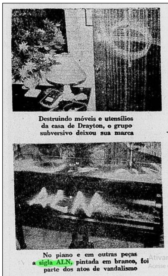
Figura 2: Escritas da Ação Libertadora Nacional.

lado mais político, até de passar a cultura pra frente, tá ligado? Por que, se você não passar ela pra frente, ela vai morrer? Assim como vieram outras pessoas antes de mim, até porque tamo em 2024, desde quando existe o pixo? Então sempre tem outras pessoas atrás, então é saber isso, um rolê de passar pra frente. Então a comunidade tem que defender isso, por mais que a gente nem sempre se reúna, por que somos poucos, mas conseguir fazer entre a gente esse rolê de passar pra frente, realmente sustentar a cultura (Entrevistada 1, 12/09/2024).