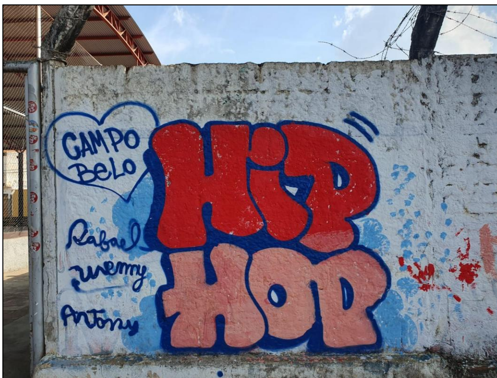
Figura 3: Graffiti hip-hop no bairro Pinheirinho, em Alfenas.