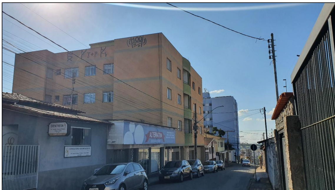
Figura 5: Pixação em prédio.