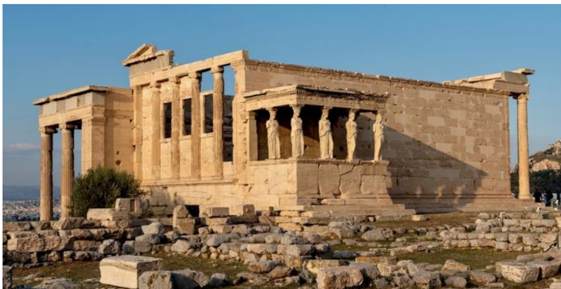
Figura 2: Erechtheion.