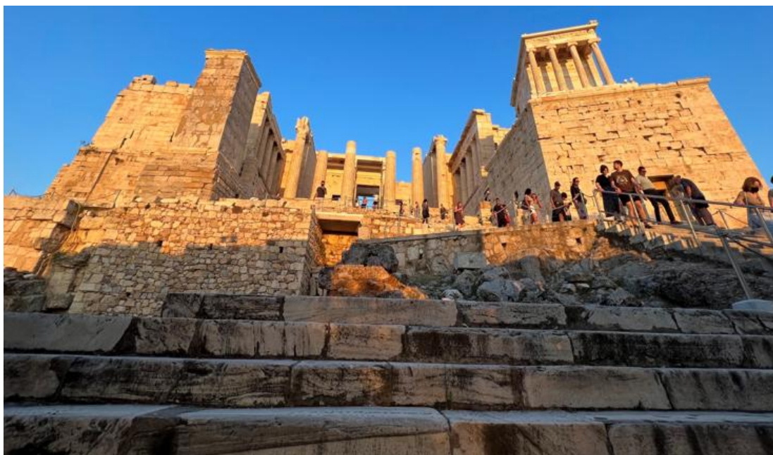
Figura 1: Propileu.

branco extraído do monte Pentélico 3 , que dá acesso, em sentido oeste-leste, à acrópole, ou seja, à entrada dos templos. A formosa e famosa escadaria que conduz a um edifício central de várias colunas ainda está bem conservada. Por ela subiram e desceram centenas de vezes renomados filósofos como Sócrates, Platão e Aristóteles. É uma satisfação poder andar sobre ela.