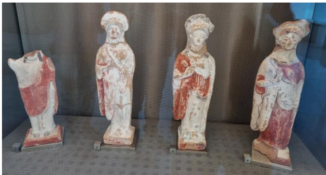
Figura 7: Atena Nike.