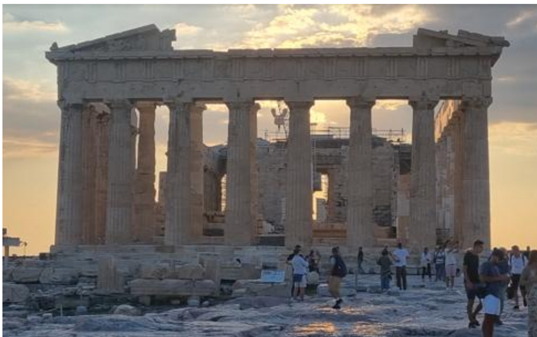
Figura 3: Partenon.