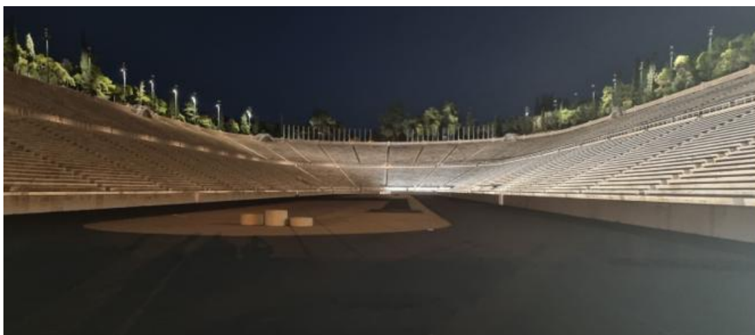
Figura 6: Kalimarmaro.