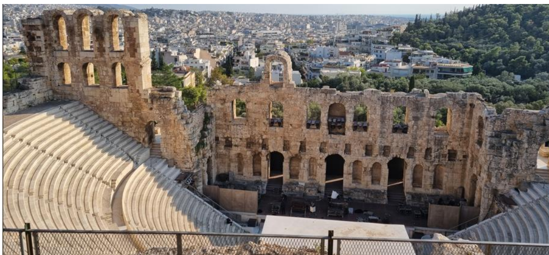
Figura 4: Odeion de Herodes Ático.

construído em 161 EC pelo cônsul romano Herodes Ático. Seu formato inicial, que atualmente se assemelha a um teatro romano, era bem menor e tinha uma cobertura. O Odeion foi restaurado em 1952 a 1953 e é atualmente um importante espaço para festivais renomados de Atenas.