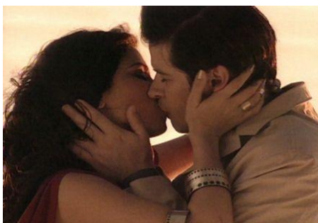
Foto 5 - Beijo

Um exemplo deste punctum barthiano é o beijo em telenovela. É ele que sela a interpretação dos personagens que suspende a trama do sofrimento, da separação e de outras mazelas que são contadas pela estória.