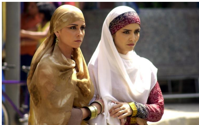
Foto 7 - Hijab