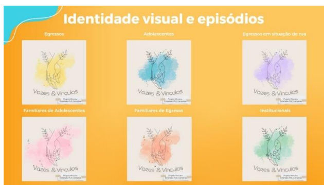
Figura 3 – Identidade visual por grupo de participantes