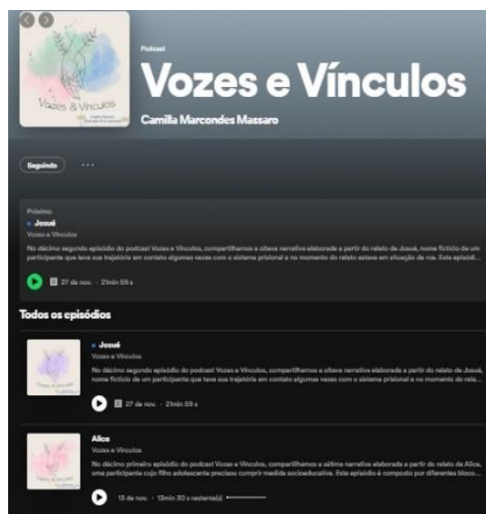
Figura 2 – Interface do podcast “Vozes e Vínculos”