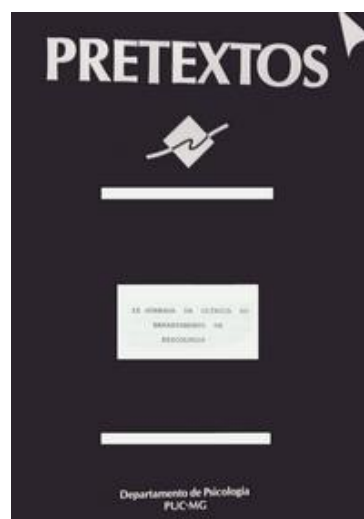
Fig. 2. Capa da Revista Pretextos original [na imagem temos uma publicação em decorrência da II Jornada da Clínica do Departamento de Psicologia da PUC Minas].