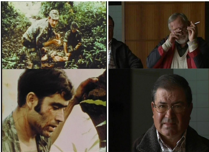
Figura 3 - Ex-soldados portugueses assistem, décadas depois, imagens que mostram a emboscada sofrida durante a guerra colonial.