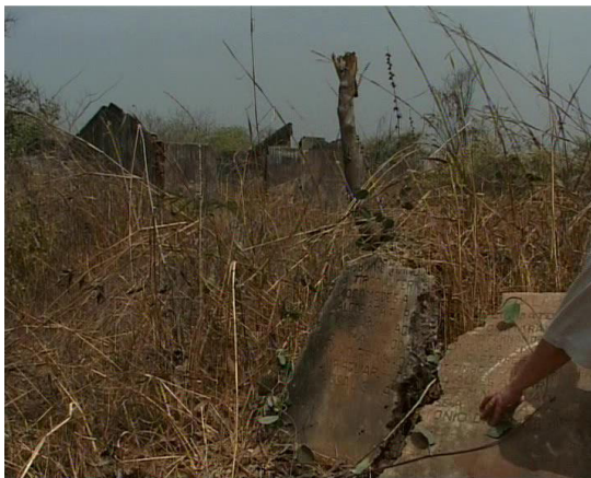
Figura 1 - A “pedra de Geba” e detalhe da mão de Diana Andringa.