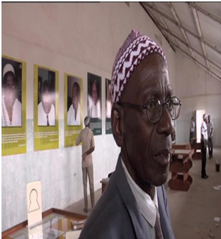
FIGURA 7 - Depoimento de um sobrevivente do Tarrafal, com painel de fotos de ex-prisioneiros.