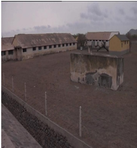
FIGURA 7 - Imagem fotográfica do Campo de concentração do Tarrafal.