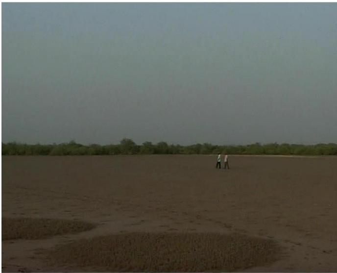
Figura 4 - Cena final do documentário.