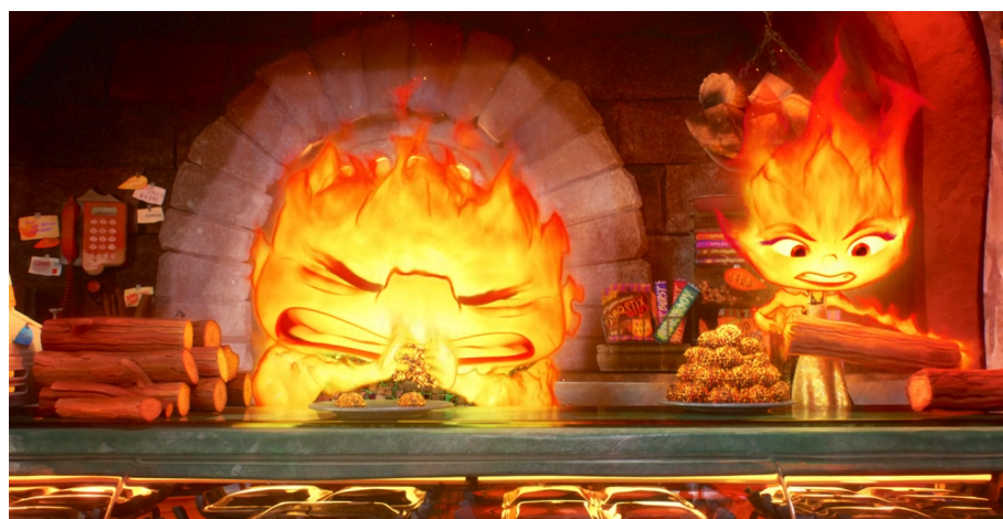
Figura 5: Imagem que exemplifica o uso de recurso natural renovável.

Fonte: Elementos, o filme. Direção de Peter Sohn. Walt Disney Pictures e Pixar Animation Studios, 2023.