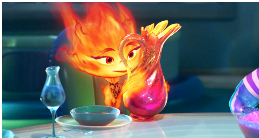
Figura 5: Imagem que demonstra as propriedades do vidro.

Fonte: Elementos, o filme. Direção de Peter Sohn. Walt Disney Pictures e Pixar Animation Studios, 2023.