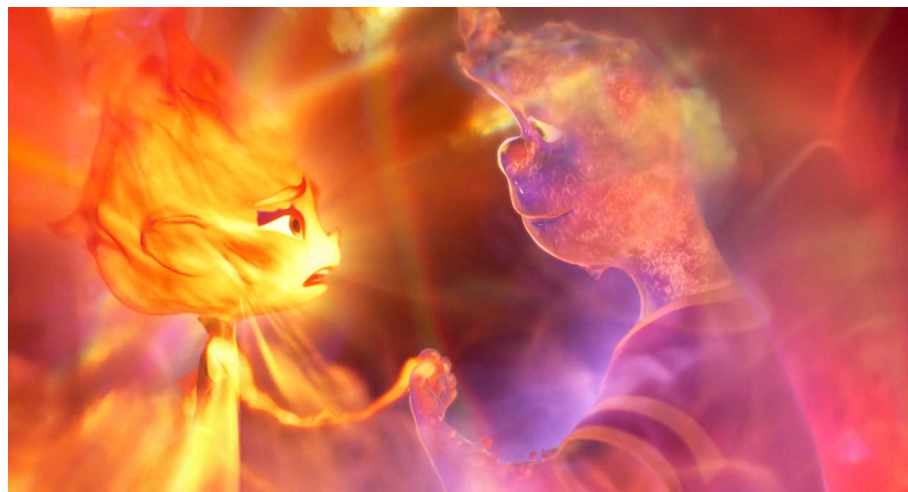
Figura 2: Imagem da transformação da água do estado líquido para o gasoso.