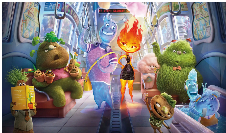
Figura 4: Exemplos dos tipos de recurso, mostrados no filme através dos personagens e seus respectivos nomes.

Fonte: Elementos, o filme. Direção de Peter Sohn. Walt Disney Pictures e Pixar Animation Studios, 2023.