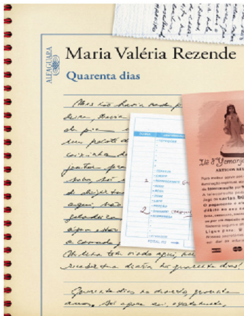
Figura 1 – Capa